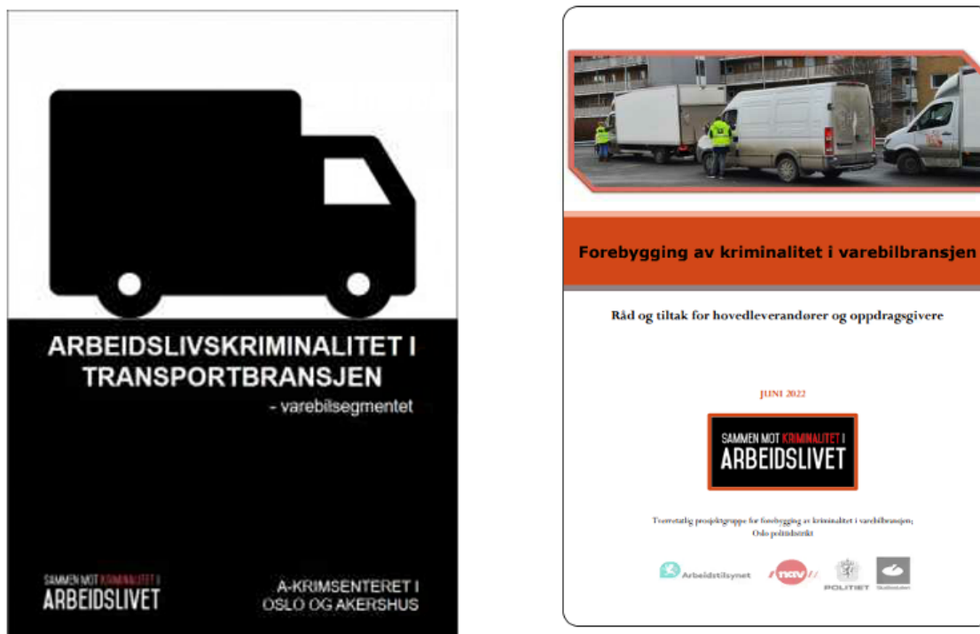
Figur 1: Arbeidslivskriminalitet i transportbransjen – varebilsegmentet (2019), Veileder – Forebygging av kriminalitet i varebilbransjen – råd og tiltak for hovedleverandører og oppdragsgivere (2022).

Rapporten er utarbeidet av A-krimssenteret i Oslo. A-krimssenteret er et tverretatlig samarbeid, bestående av medarbeidere fra Arbeidstilsynet, NAV, politiet, Skatteetaten og Tolletaten. A-krimssenteret i Oslo har tidligere publisert en offentlig rapport som omhandler kriminalitet i varebilbransjen 3 , samt bidratt til en veileder for hovedleverandører og oppdragsgivere i bransjen. 4