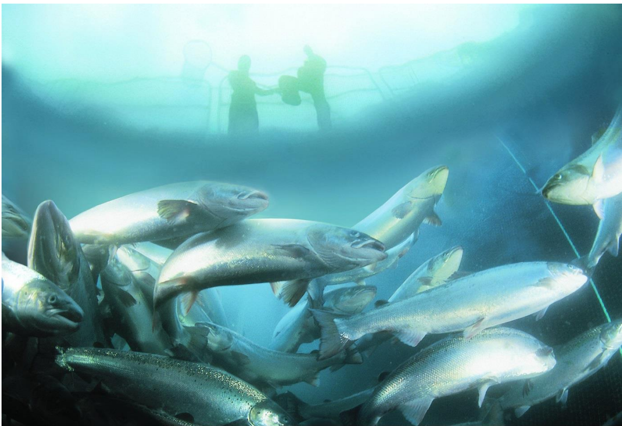
Menneske og laksen.

Havbruksnæringen har utviklet seg til å bli verdens ledende på eksport av laks og ørret, og næringen står sterkt i Trøndelag. Fiskeindustrien opplever gode priser og god avsetning. Det forventes økt behov for arbeidskraft de kommende årene og både næringen selv og markedene tror på en blomstrende vekst fremover. Adresseavisen 12 har den 23.11 som hovedoppslag at havbruk i Trøndelag vil øke sysselsettingen med nesten 40 000 personer de kommende årene. I kystkommunene er havbruk en av de viktigste næringene og markedskontaktene i fylket forventer stor etterspørsel fra næringen. Fra Hitra, Frøya og Ytre Namdal meldes at det kommer nye konsesjoner på oppdrett, noe som også gir ringvirkninger til lokalmiljøet og andre bedrifter. Også fra Trondheim meldes det om stor aktivitet innenfor havbruksnæringen, da en god del av bedriftene også er lokalisert med avdelinger i Trondheim. Næringen har behov for mange typer arbeidskraft. Det gjelder i produksjonen, men også innenfor teknologi, produktutvikling, markedsføring og salg.