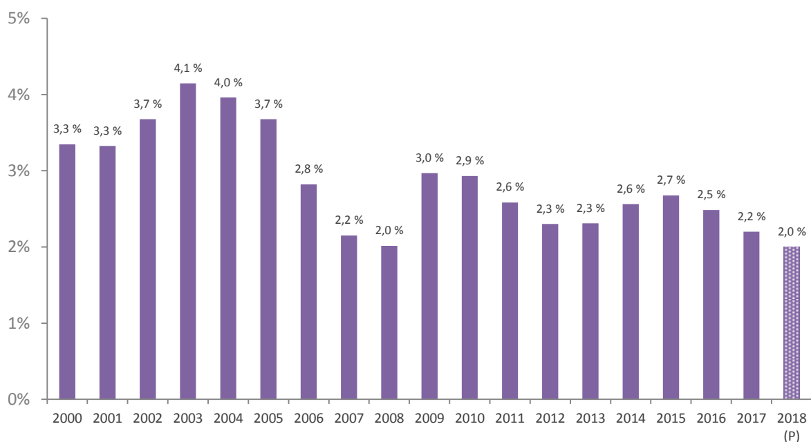
Figur 1. Ledighetsutvikling, årsgjennomsnitt og prognose 2018